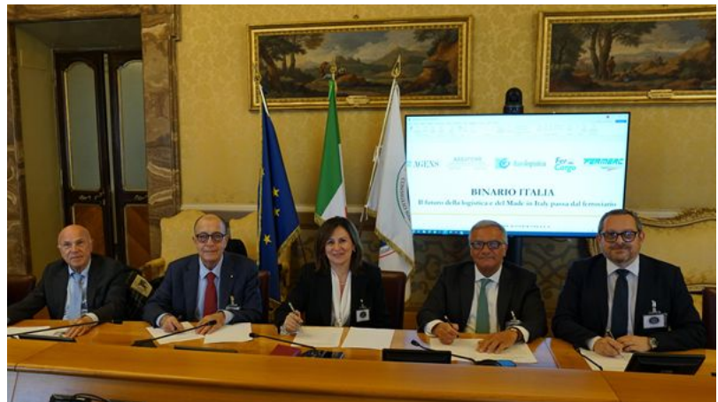
Agens, Assoferr, Assologistica, Fercargo e Fermerci uniscono le forze per superare il momento di crisi